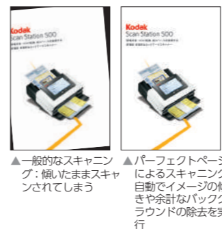
▲一般的なスキャニング：傾いたままスキャンされてしまう ▲パーフェクトページによるスキャニング：自動でイメージの傾きや余計なバックグラウンドの除去を実行