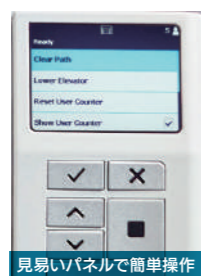
見やすいパネルで簡単操作